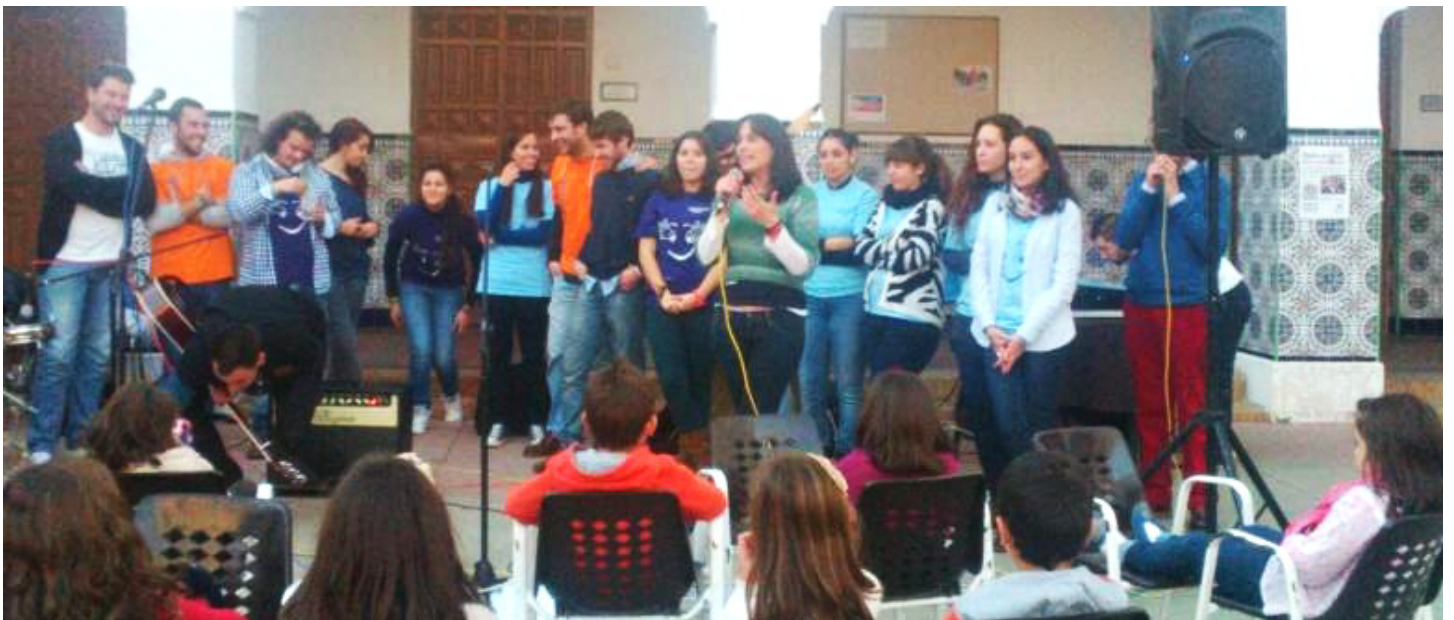
1 Concurso de Villancicos