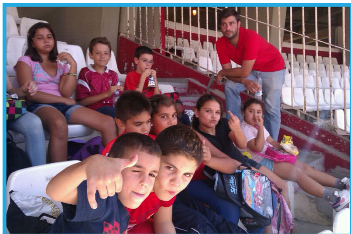
Partido Sevilla FC - Almería