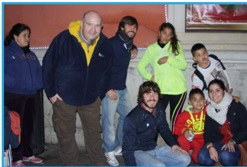
Centro de Sevilla